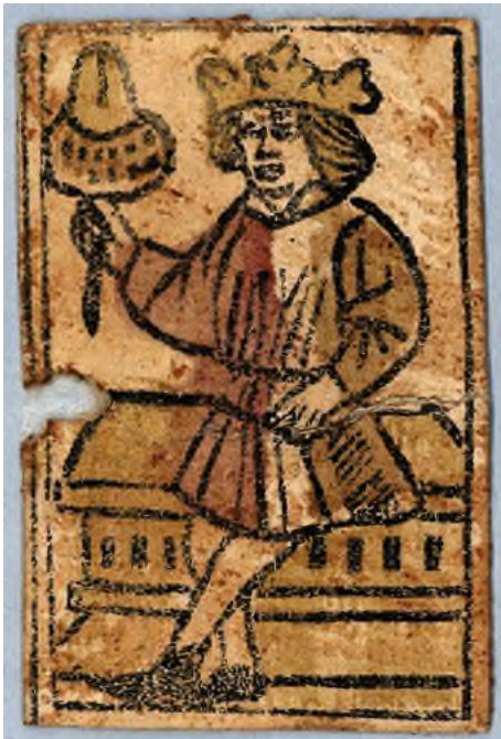
Abb. 9 Eichel-König aus einem Kartenspiel des Basler Bildes der Zeit um 1520. Die Karte wurde 1998 zusammen mit 59 weiteren Exemplaren beim Restaurieren eines Bucheinbands aus dem Staatsarchiv Schaffhausen gefunden. Deutlich zu erkennen sind die Frassspuren des Bücherwurms.

aus dem Ende des 15. Jahrhunderts. Die Blätter zeigen noch keine einheitlichen Figuren, es gibt verschiedene lokale Varianten. Es handelt sich meistens um Funde, die beim Restaurieren von Buchdeckeln oder unter Bretterböden