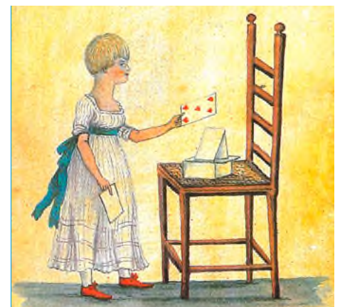
Abb. 5 Spielendes Mädchen, Ausschnitt aus einem handgemalten Kartenspiel von Edward Hawke Locker, London 1799 (Faksimile).

des französischen Kartenbildes sowie die Geschichte von Tarock und Tarot (Abb. 2 - 3). Es werden verschiedene Kartenspiele wie Poker, Whist, Bridge und Patience vorgestellt. Die Ausstellungseinheit «Spielkarten in der Populärkultur» beleuchtet den Stellenwert des Kartenspiels in Literatur, Film und Musik des 20. & 21. Jahrhunderts (Abb. 4). In verschiedenen Spielbereichen