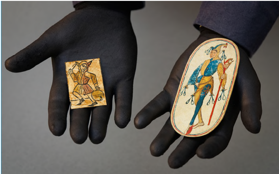
Abb. 8 Grössenvergleich zwischen einer handgemalten und einer gedruckten Spielkarte. Rechts: Schlinge-Bube (als Hofnarr) aus dem «Flämischen Jagdkartenspiel» von 1475/80 (Faksimile). Es handelt sich um das älteste vollständig erhaltene handgemalte Kartenspiel Europas. Links: Schellen-Unter aus einem Kartenspiel des Basler Bildes, Holzschnitt, schablonenkoloriert, Basel, um 1520.

aus dem Ende des 15. Jahrhunderts. Die Blätter zeigen noch keine einheitlichen Figuren, es gibt verschiedene lokale Varianten. Es handelt sich meistens um Funde, die beim Restaurieren von Buchdeckeln oder unter Bretterböden