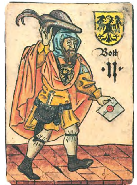
Abb. 7 «Der Bote» aus dem «Hofämterspiel», Wien, vor 1460 (Faksimile). Das Hofämterspiel hat seinen Namen von den Berufsdarstellungen, die auf den meisten seiner 48 Kartenblätter zu sehen sind und die Aufgabenbereiche an einem Fürstenhof betreffen.

Die frühesten aus der Schweiz erhaltenen Spielkarten stammen