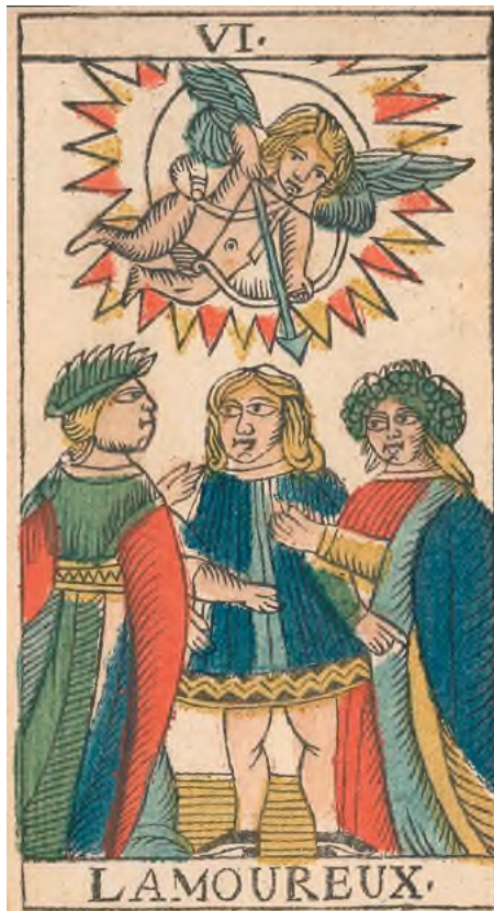
Abb. 2 Tarockkarte «Die Liebenden» aus einem sogenannten «Marseiller Tarock» von Bernhard Schär, Mümliswil 1784.

Fundstücken bis zu zeitgenössischen Künstlerkarten. Diese stammen aus der museumseigenen Sammlung, die mit über 16'000 Kartenspielen zu den grössten und bedeutendsten der Schweiz zählt. Zahlreiche Leihgaben aus Schweizer Museen und Archiven bereichern die Schau, ebenso sind Schriftdokumente Spieltische und Gemälde zu bewundern.