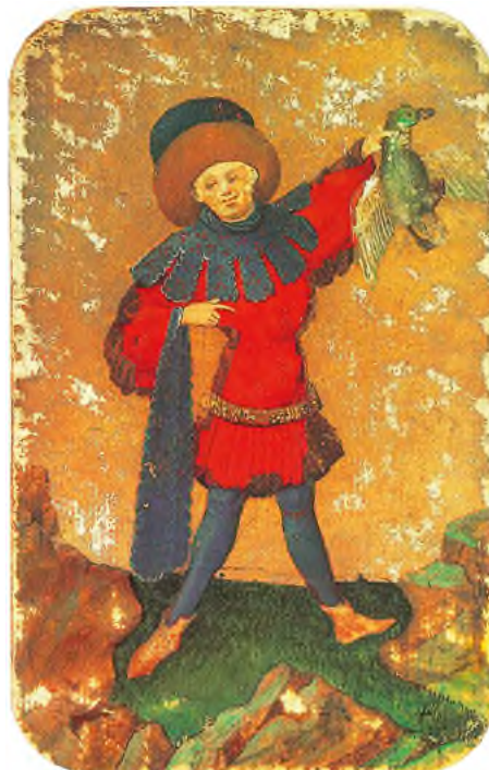
Abb. 6 Enten-Ober aus dem ältesten, allerdings unvollständig erhaltenen Kartenspiel Europas, dem «Stuttgarter Kartenspiel», gemalt zwischen 1427 und 1431 am Oberrhein (Faksimile).

Stadt Bern aus dem Jahre 1367, aus Schaffhausen ist ein solches aus dem Jahre 1389 belegt. Leider wissen wir nicht genau, wie diese Karten aussahen. Denn das älteste bis heute erhaltene